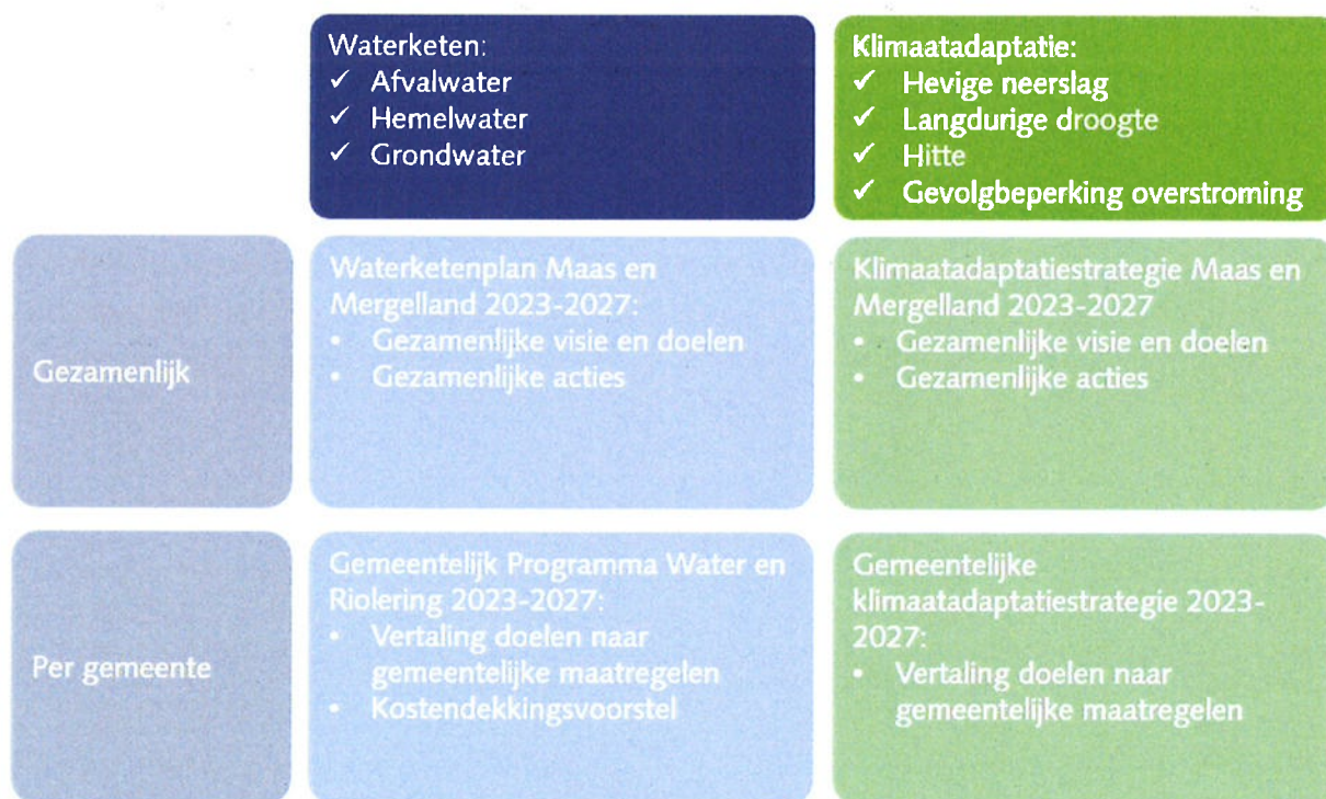
Figuur 1 (voor onze gemeente gelden jaartallen 2024-2027)

Binnen het samenwerkingsverband (Afval)waterbeheer Maas en Mergelland zijn het Waterketenplan, de Waterprogramma's en de Klimaatadaptatiestrategieën opgesteld. (zie figuur 1)